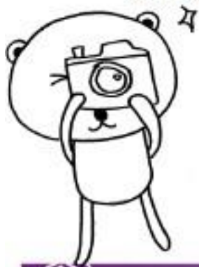
晶片護照相片規格說明